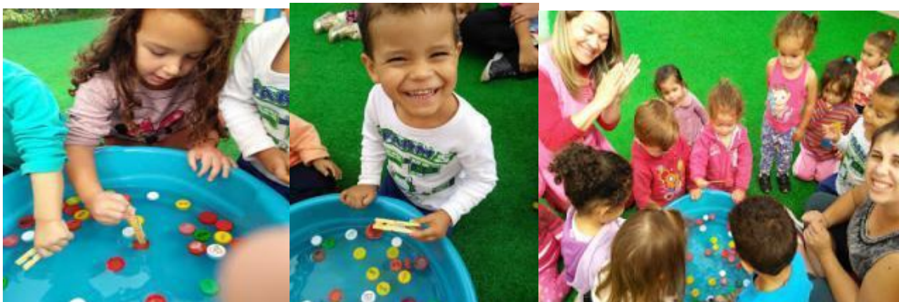
Imagens da atividade.