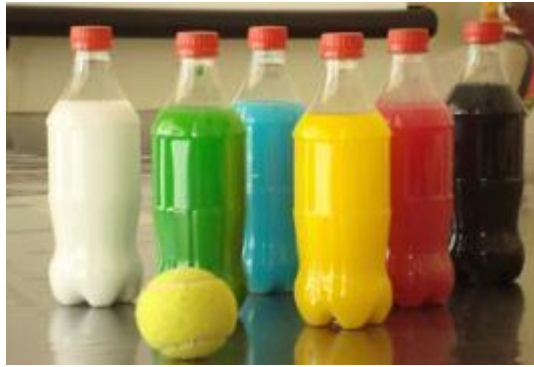
Imagem da atividade.