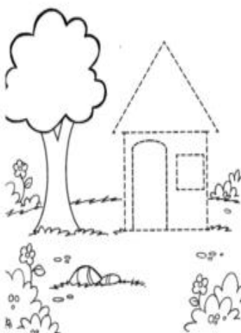
Imagem da atividade.